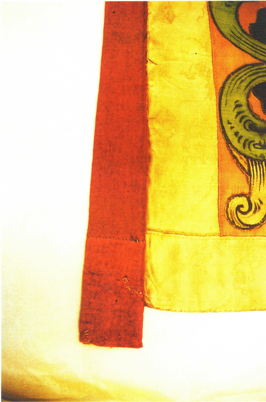
Bild 2. Skarvad strumpa, äldre lagning och mindre hål.